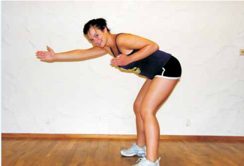
Diese Rückenübung macht den Bauch flach, aber nur 30 sec lang

Auch wenn Ihr Kopf „meint“, das sei zu wenig für Sie. Die Ergebnisse werden Sie überzeugen! Ihr Körper wird plötzlich wieder reagieren. Ihre Leistungen werden besser, Ihre Muskeln verändern sich. Und damit auch die Figur! Ist doch ganz einfach.